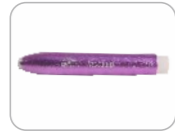
Pièce a Main X2