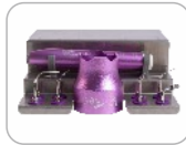
Autoclave box × 1