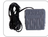
Pedal × 1