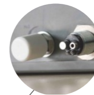
Connection Externe de L'eau