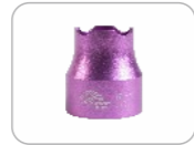
Clé pour insertx 1