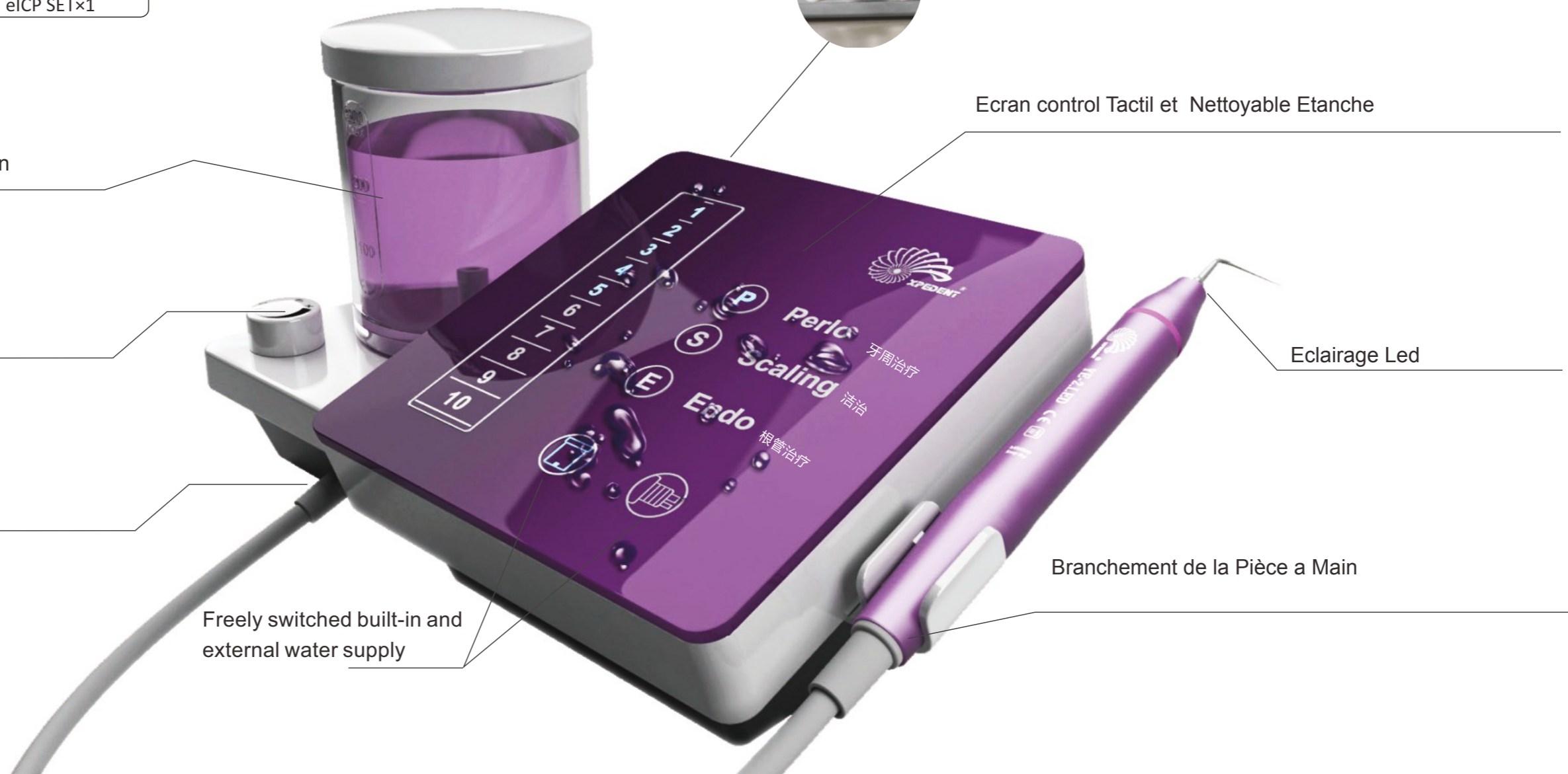
Branchement de la Pièce a Main